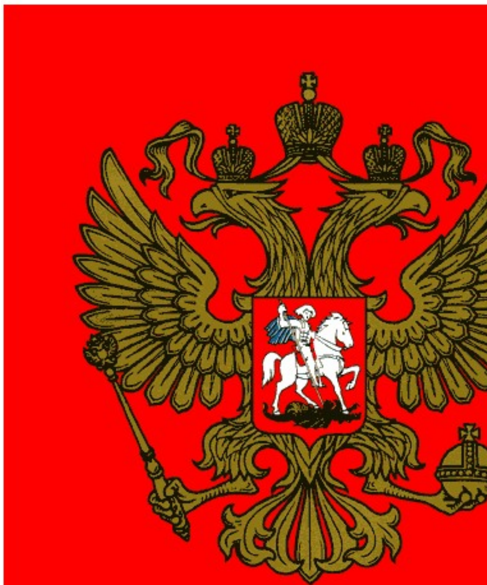
Рисунок Государственного герба Российской Федерации в многоцветном варианте

Приложение 1 к Федеральному конституционному закону "О Государственном гербе Российской Федерации"