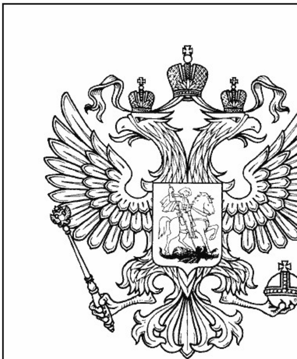
Рисунок Государственного герба Российской Федерации в одноцветном варианте

Приложение 2 к Федеральному конституционному закону "О Государственном гербе Российской Федерации"