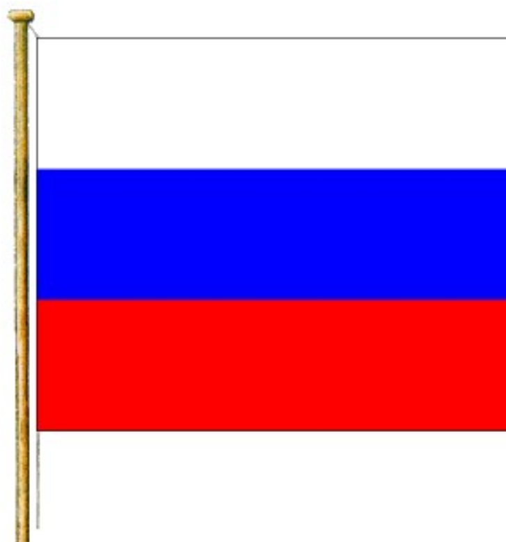
Многоцветный рисунок Государственного флага Российской Федерации

Приложение к Федеральному конституционному закону "О Государственном флаге Российской Федерации"