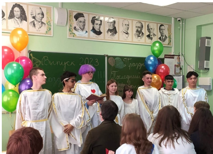
Праздник «Последний звонок» 12 классы 2023год.