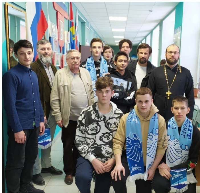
Встреча учеников, членов спортивного клуба, с тренером команды футболистов «Зенит» Семаком Сергеем Богдановичем. Апрель 2023г.