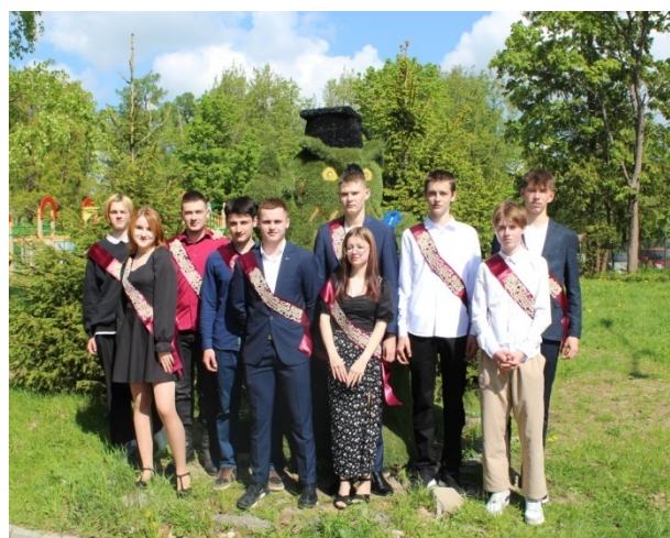
Праздник «Последний звонок» в 9 классах.