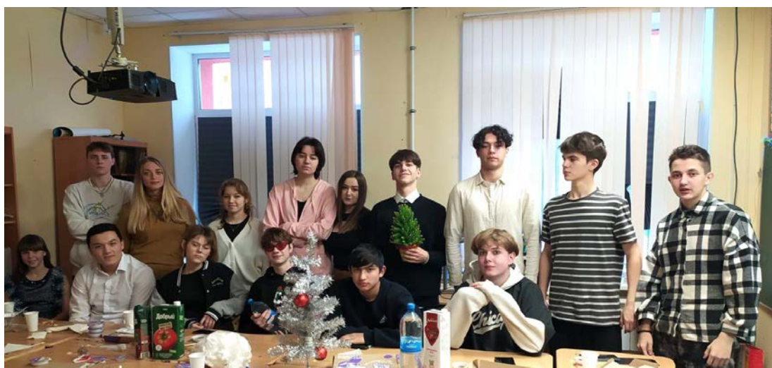
Новогодний праздник в 10-а классе